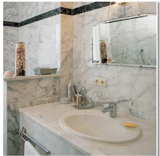
Das Marmorbad. Verlegt mit den LUGATO Produkten für Marmor und Granit.