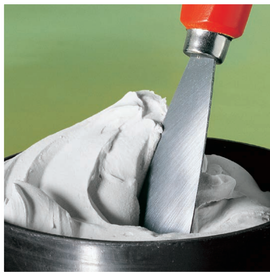
Weißer Naturgips für viele Arbeiten im Haus und in der Wohnung.

Je nach Verwendungszweck 1,5-2,0 Volumenteile GIPS in 1 Volumenteil Wasser (= 0,5-0,7 l Wasser/1 kg GIPS) einstreuen und klumpenfrei rühren. Nur soviel Material anrühren, wie innerhalb 10 Minuten verarbeitet werden kann. Bei mehreren Ansätzen Werkzeug und Gefäß zwischendurch reinigen.