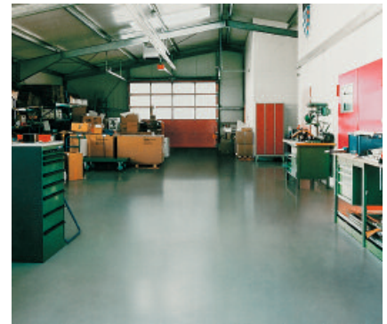
PCI Apoten-Beschichtung in einem Gewerbebetrieb mit hoher mechanischer und chemischer Belastung.