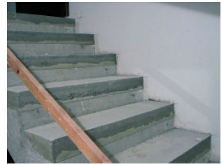
Aufgrund seiner Eigenschaften eignet sich PCI Novoment M3 plus auch hervorragend zum Höhenausgleich von Betontreppenstufen.