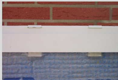
Abb. 5 Komplettansicht mit DS-Abschlussleiste.

Vorstehende Angaben wurden aus unserem Herstellerbereich nach dem neuesten Stand der Entwicklung und Anwendungstechnik zusammengestellt.