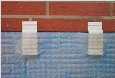
Abb. 3 Schutzbahn hinter DS-Clips ziehen. Vlies vor den DS-Clips positionieren.