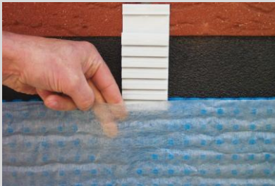
Abb. 2 Vlies ca 10 cm von der Dränbahn lösen.