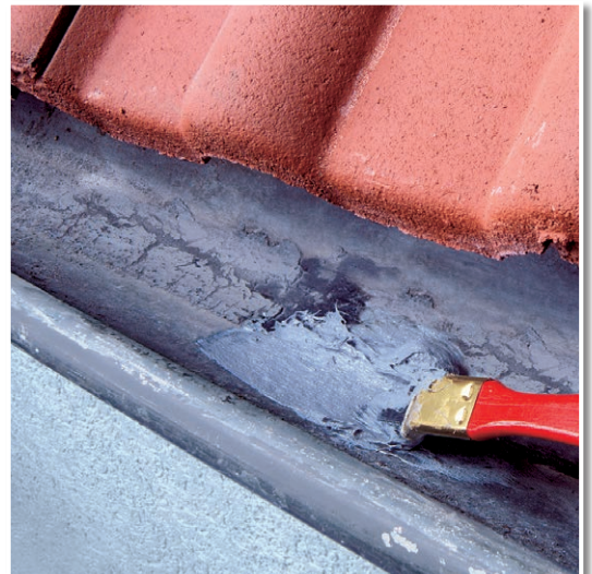
Reparatur einer Regenrinne mit SOFORT DICHT!.