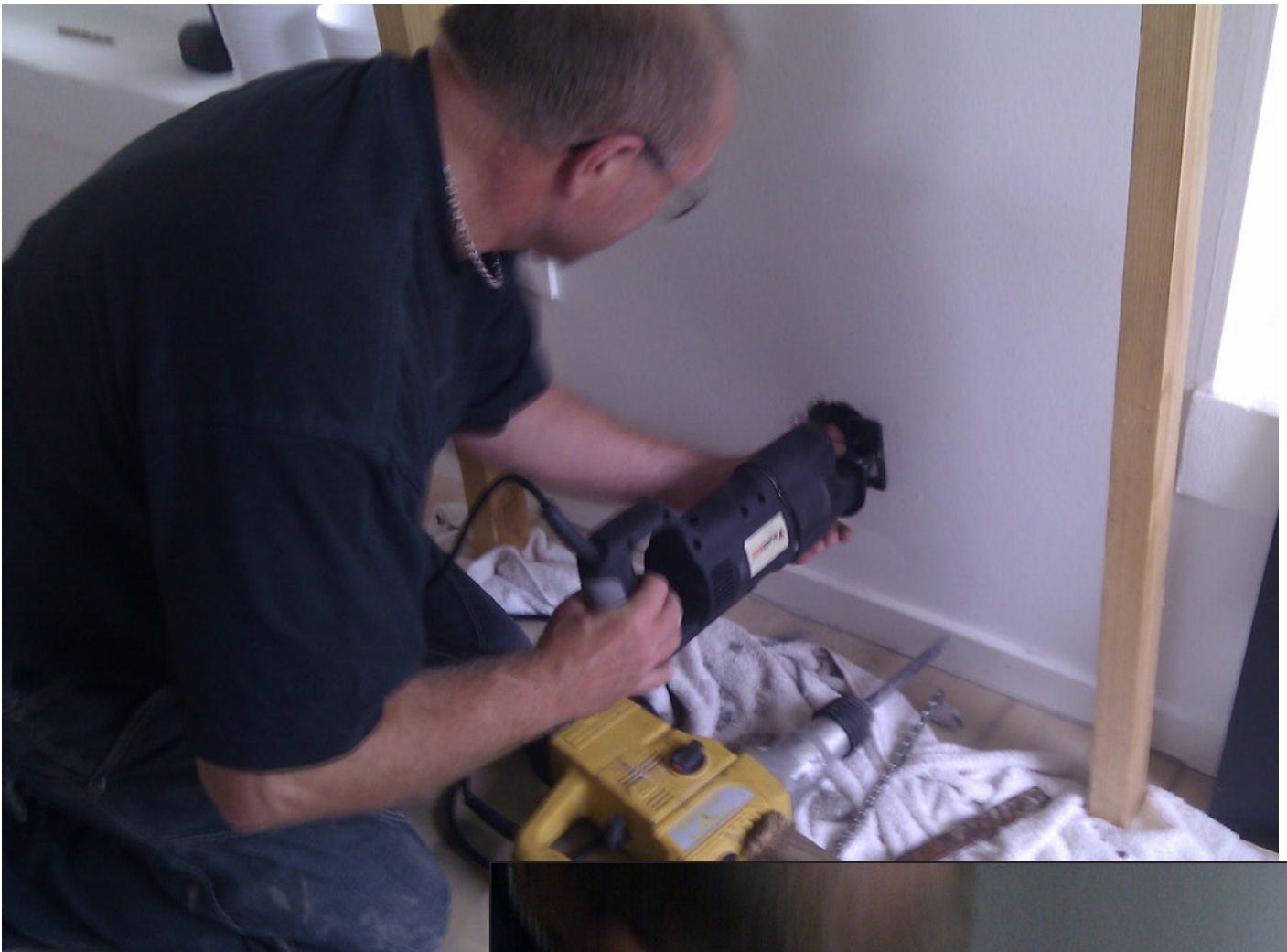
5: Die Bewehrung wurde mit einer Stichsäge entfernt.