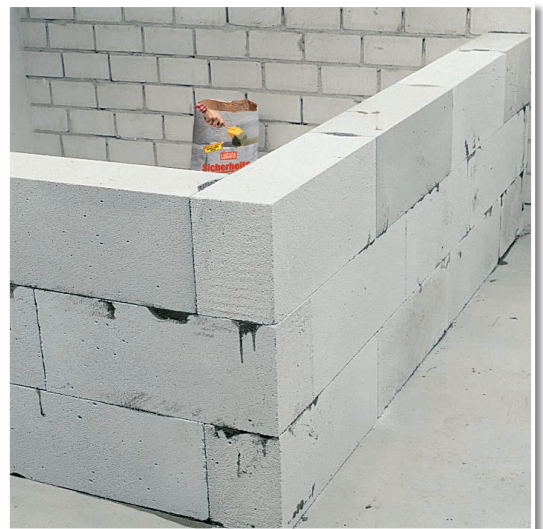
Mit SICHERHEITSKLEBER PORENBETON geklebte Wände.