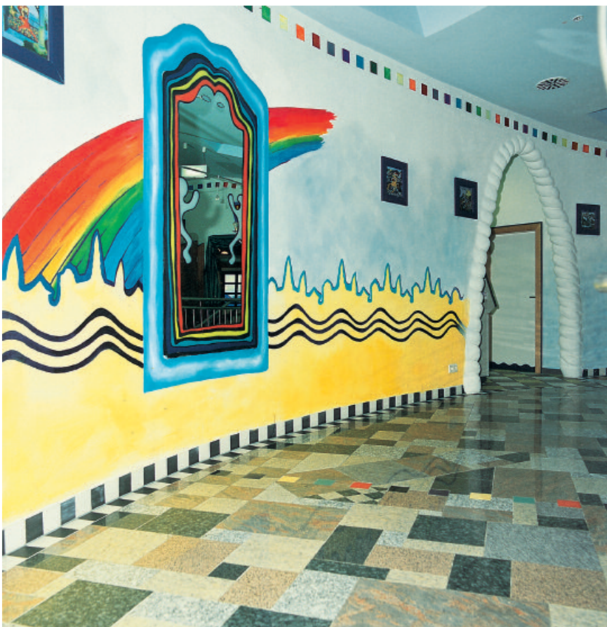
Raststätte Illertal