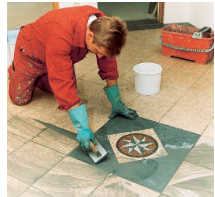
Die Fugen bei Feinsteinzeugbelägen können in einer Breite von 1 - 10 mm mit PCI FT® Megafug verfugt werden.