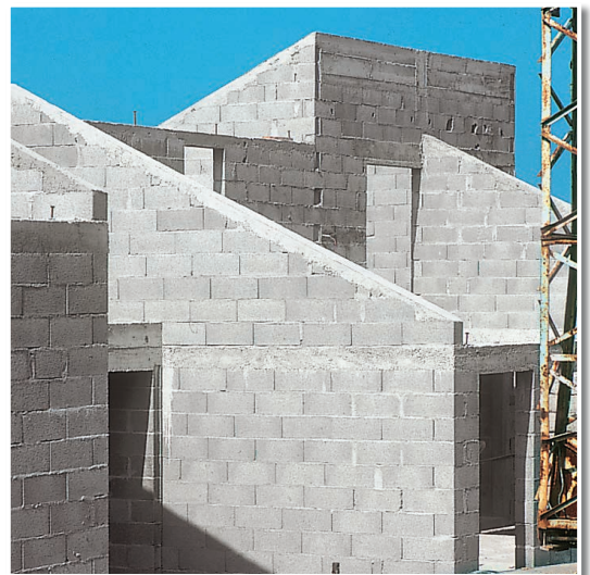
Wohnsiedlung. Vorbereiten von Planblockmauerwerk für Dekorputze mit ROHBAUSPACHTEL AUSSEN.