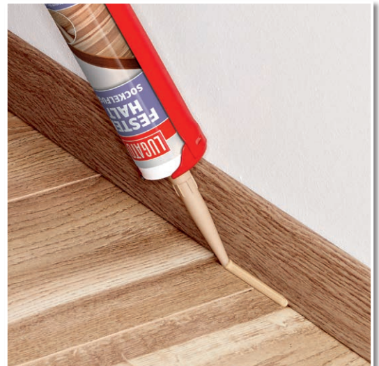
FESTER HALT: im Farbton passend zur Sockelleiste.