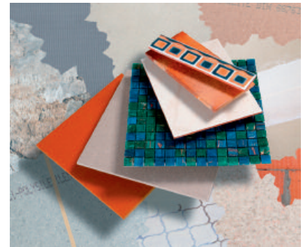
Variables Leistungsspektrum – für alle Untergründe und alle keramischen Beläge.