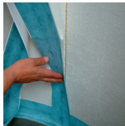
Schutzfolie abziehen und PCI Pecitape WS ohne Vorspannung mit kräftigem Druck aufkleben – fertig!